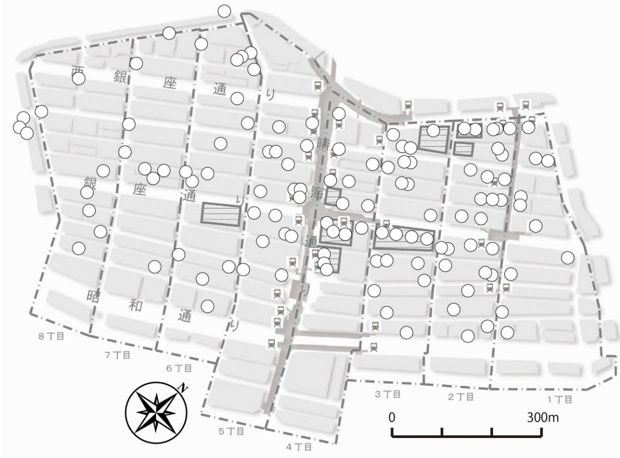
【図-1】銀座地区におけるカフェの分布 (地下鉄出入口及び大規模店舗を付記)

銀座地区のカフェ122件の分布は、エリア区分では、2丁目が一番多く、南北方向の両端である1丁目、7丁目、8丁目には比