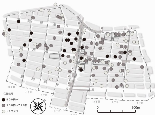
【図-4】銀座地区におけるカフェの価格別分布 (レギュラーコーヒー一杯の値段)