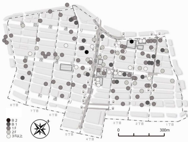
【図-2】銀座地区におけるカフェの立地階別分布

エリア別の傾向を見ると、1丁目では小規模カフェの割合が6割と大きいことが分かる。2丁目、3丁目も、4丁目以南に比べると小規模カフェの割合が大きい。5丁目から8丁目には15席未満のカフェは立地していない。一方、4丁目には81席以上の