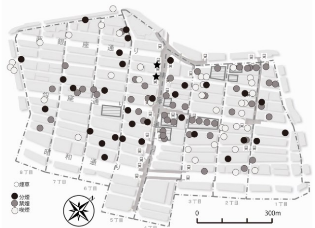
【図-5】銀座地区におけるカフェの喫煙/禁煙別分布