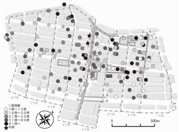
【図-3】銀座地区におけるカフェの店舗規模別分布