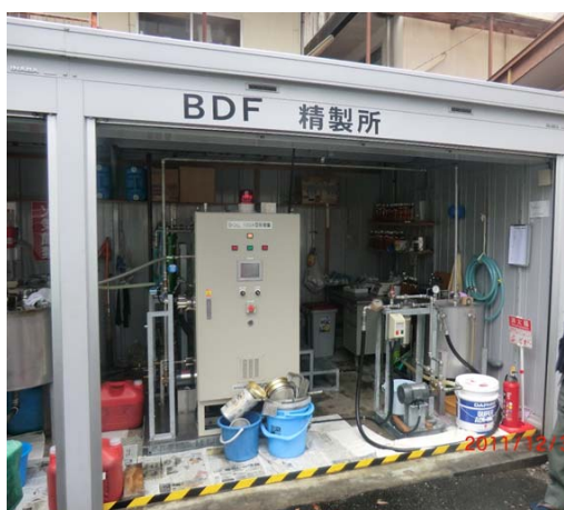
写真3 BDF 精製装置

2003 年は内子地区普及期と解釈することができる。この年より旧内子町では生ごみの分別収集がはじまったが、そのにおい消しのため、「えひめ AI-I」を自ら培養し配布を始める(写真 1)。このとき役場から補助をいただくにあたり、役場の環境部署からは法人格を持っていることが補助の条件として提示された。そこで NPO 法人格を取得し、環境 NPO「サン・ラブ」を設立する。さらに、試行期のときに培った自治センター(2001 年に公民館から改称)とのつながりが生きて、「えひめ AI-I」を公民館に置かせてもらい、自由に使ってもらえるようになる(写真 2)。町民に自由に使ってもらえるようにすることも役場の補助の条件であった。「えひめ AI-I」の使用に慎重だった自治会も、役場の後ろ盾を得ると信用するようになり、ほとんどの自治会で出前講座を実施することができ、旧内子町内での普及が一気に進んだ。この時期も役場という、地区外の組織とのつながりが、自治会内の活動促進に役立ったと言える。