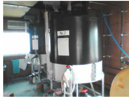
写真1 えひめAI-Iの培養装置

となった分館外の仲間に EM 菌を使ってもらえた。1995 年ごろから公民館の協力を得て公民館講座として「EM ボカシ研究会」が開催され、ボカシを公民館に置いてもらえるようになり、しかも EM 菌代を公民館が負担してもらえたが、2001 年以降「えひめ AI-I」が開発されたのを知り、「えひめ AI-I」を自治会で培養することを提案したが、自治会からは受け入れられなかった。以上のように I 氏はこの時期、主として分館館長(1991～95)としてのつながりを活かして普及を試みたがうまくいかず、むしろ地区外で成果が上がっていたと言える。