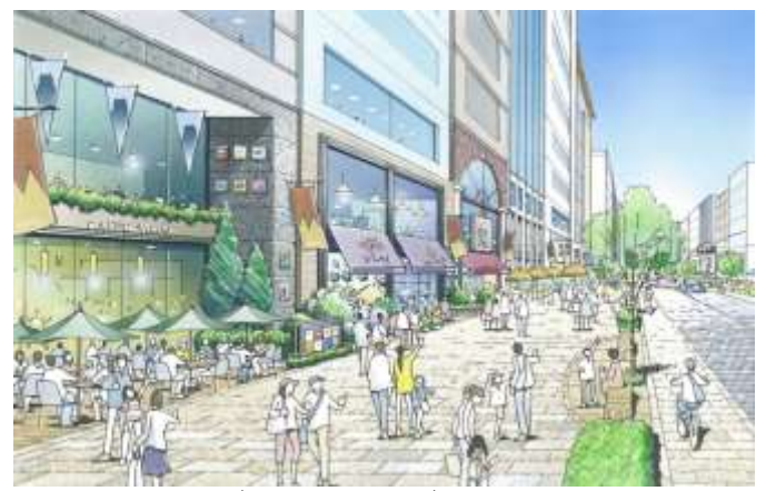
御幸通り沿道 (JR静岡駅周辺)