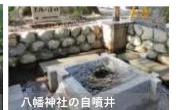
八幡神社の自噴井