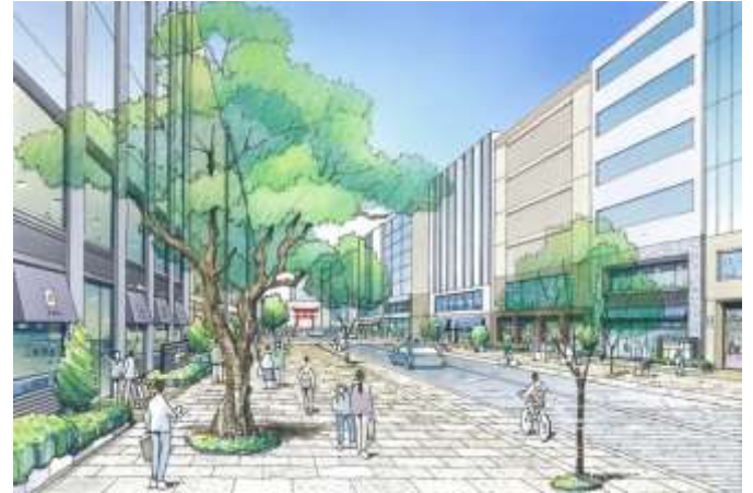
御幸通り沿道 (市役所周辺)