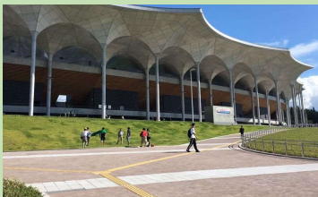
■新青森県総合運動公園 [青森県青森市]