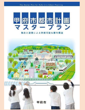
■市町村マスタープラン [山梨県甲府市]