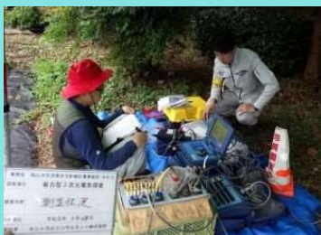
■三次元電気探査（地下水保全対策）