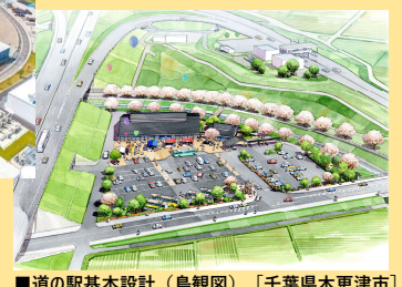
■道の駅基本設計（鳥観図） [千葉県木更津市]