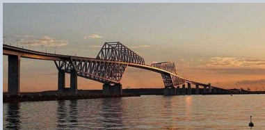
■東京ゲートブリッジ景観設計