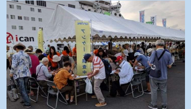
■クルーズ旅客へのアンケート調査