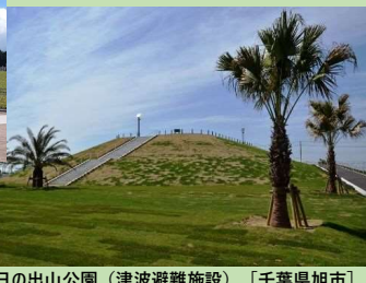
■日の出山公園（津波避難施設） [千葉県旭市]