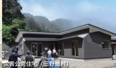
災害公営住宅（田野畑村）