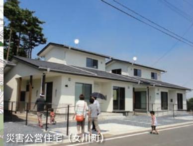
災害公営住宅（女川町）