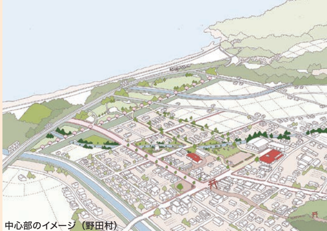
中心部のイメージ（野田村）