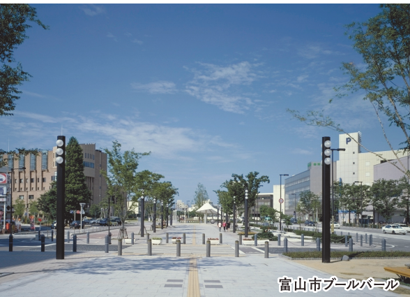
富山市ブルーパール