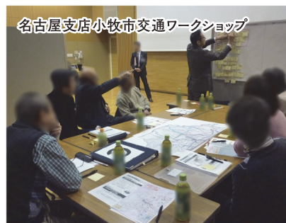
名古屋支店小牧市交通ワークショップ

地方鉄道や路線バス等の地域公共交通に関わる計画策定の支援とワークショップ等の地域住民との対話を通じ利用者目線での計画づくりを行っています。