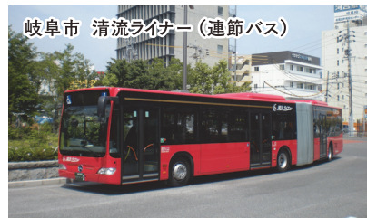
岐阜市 清流ライナー（連節バス）

弊社では、東日本大震災後、復興支援に向けて仙台支店を中心に、被災住民の安全・安心な「新たなまち（集団移転先住宅団地・災害公営住宅団地）」の造成に係る詳細な事業計画の作成、住宅地整備に向けた調査・設計・管理及びまちづくり検討の総合支援等に携わっています。