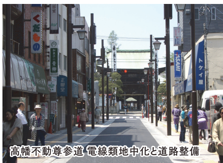
高幡不動尊参道 電線類地中化と道路整備

都市の主要な公共空間の計画・設計にあたり、賑わい・交流の場や歩きたくなる場づくりを進めるとともに、地域に愛される場となることを目指しています。