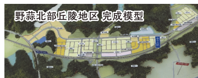
野蒜北部丘陵地区 完成模型

我が国は、少子高齢化、人口の減少、地球環境の深刻化、既成市街地の空洞化、美しいまちづくりへのニーズの増加等の経済社会の変化・課題が生じてきております。今、まちづくりは、これまでの成長型の都市づくりから成熟型・持続可能なまちづくりへと転換していくのに対応して、地域の住民や事業者等が主体となったまちづくりが必要となっております。私たちは、これからも国、地方公共団体、市民、民間等の顧客のニーズに対して迅速に、そして的確にお応えするとともに、健康で安心、快適に生活でき、そして美しい国土・まちづくりを目指します。