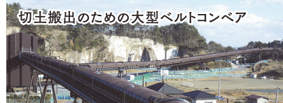
切土搬出のための大型ベルトコンベア