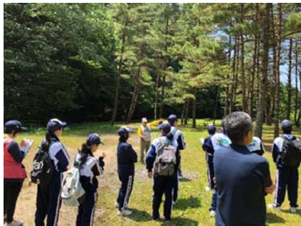
別子銅山産業遺産創造塾(フィールドワーク)