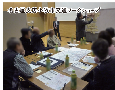
名古屋支店小牧市交通ワークショップ

地方鉄道や路線バス等の地域公共交通に関わる計画策定の支援とワークショップ等の地域住民との対話を通じ利用者目線での計画づくりを行っています。