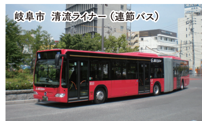
岐阜市 清流ライナー（連節バス）

弊社では、東日本大震災後、復興支援に向けて仙台支店を中心に、被災住民の安全・安心な「新たなまち（集団移転先住宅団地・災害公営住宅団地）」の造成に係る詳細な事業計画の作成、住宅地整備に向けた調査・設計・管理及びまちづくり検討の総合支援等に携わっています。