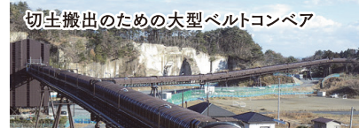
切土搬出のための大型ベルトコンベア