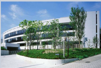
■桐蔭学園小学部第二校舎