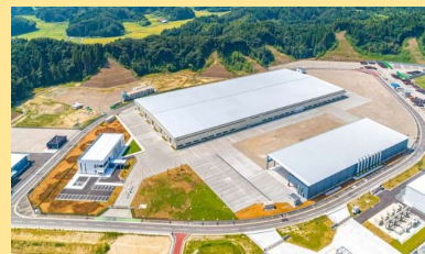
■茂原にはいる工業団地 [千葉県茂原市]