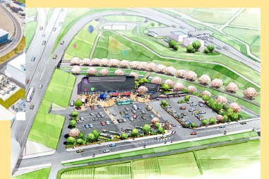
■道の駅基本設計 (鳥観園) [千葉県木更津市]