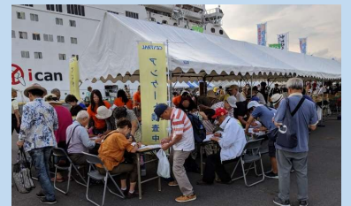
■クルーズ旅客へのアンケート調査