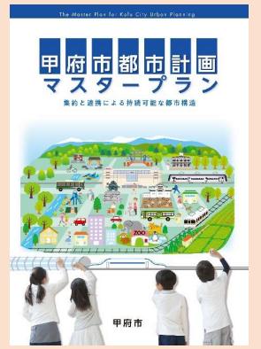
■市町村マスタープラン [山梨県甲府市]