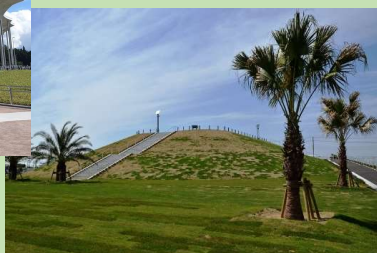
■日の出山公園 (津波避難施設) [千葉県旭市]