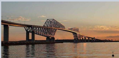
■東京ゲートブリッジ景観設計