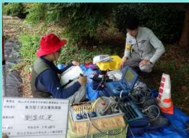
■三次元電気探査 (地下水保全対策)