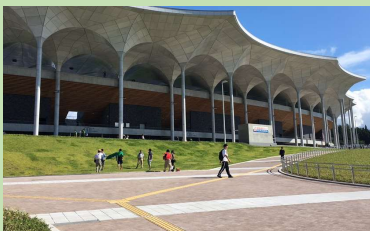
■新青森県総合運動公園 [青森県青森市]