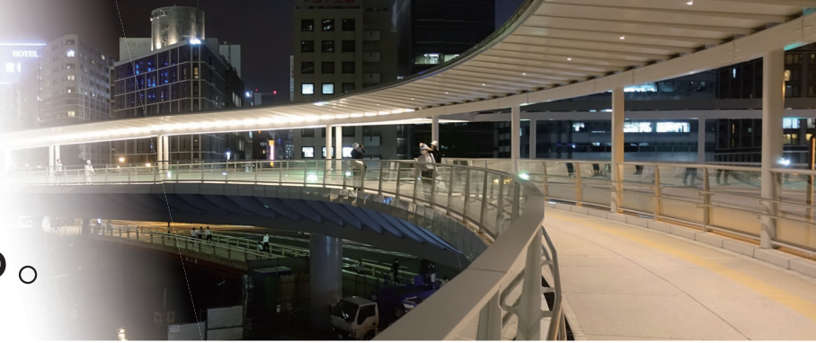
さくらみらい橋（横浜市）