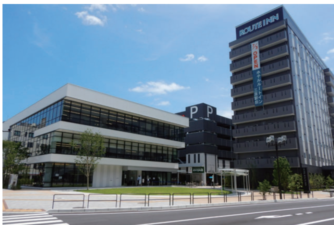
三原市駅前東館跡地活用事業（広島県三原市）

人口減少、公共施設の老朽化、厳しい財政状況などの様々な社会課題や急速な技術革新等を背景に、SDGsやSociety5.0への対応をはじめ、私たちに求められる社会的要請は複雑化・高度化しています。このような中、私たちが目指すのは「地域/事業推進の総合アドバイザー」です。まちづくりや官民連携事業等で培われたマネジメントのノウハウをいかに発揮し、各分野の専門家との協働を通じて、持続可能な社会システムの構築に貢献します。