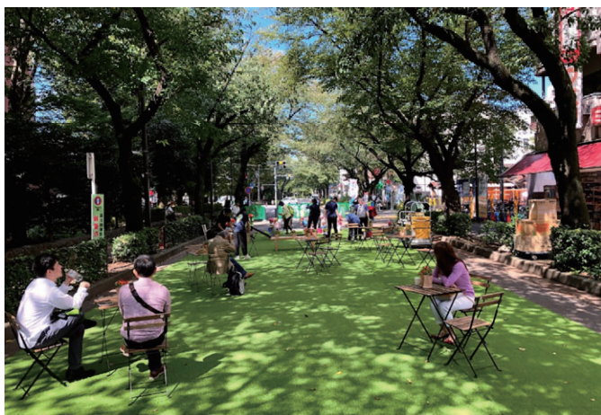
ウォークラブル都市空間の形成に向けた社会実験（東京都武蔵野市）

私たちは、まち、みち、かわ、みなどあらゆるフィールドで、民間活力も含めて様々な手法や制度を用い、各分野の専門家との連携や市民参加により、歴史や文化、景観、農業・商工業等の産業基盤、コミュニティに至るまで地域を丹念に読み取り、地域にふさわしいまちづくりを提案します。