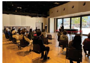
公園に開けたホールでの演奏会