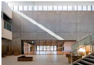
屋内外につながる多目的ホール