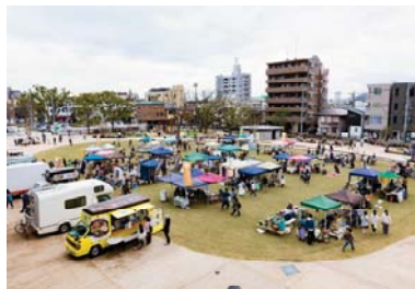
公園ひろばを活かした地域イベント (Sun Sun マルシェ)