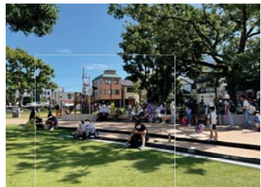
憩いの場となる新たな公園ひろば