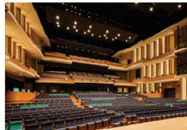
平塚の風景 七夕まつりをモチーフとした大ホール