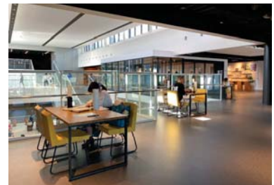
日常的なまちの居場所となる