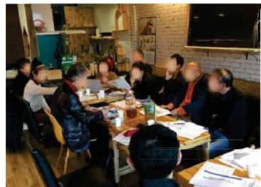
地元地域団体とつくる施設づくり