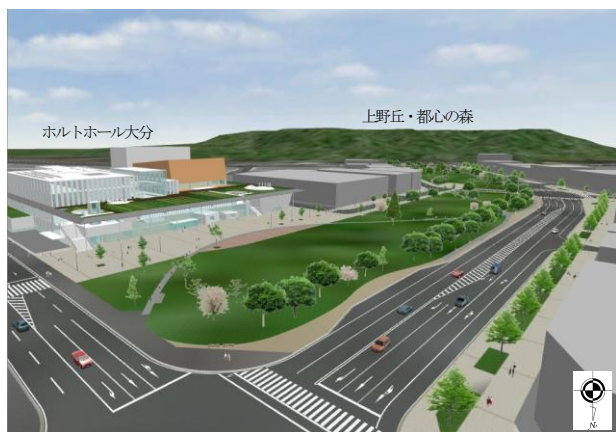
シンボルロードイメージパース

シンボルロードは延長約444m、幅員100mの都市計画道路であり、幅員100mの道路は札幌大通公園、名古屋久屋大通と若宮大通、広島平和大通りの4つしかなく、戦後の既成市街地の区画整理事業で、このような