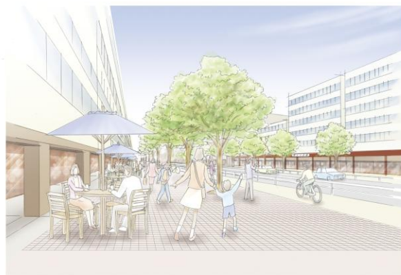
市道中央通り線イメージパース

現在、学識経験者や事業者、交通事業者、公安委員会、行政機関等々から構成される実証実験実施に向けた協議会を設立し、その実施方法について協議中であります。