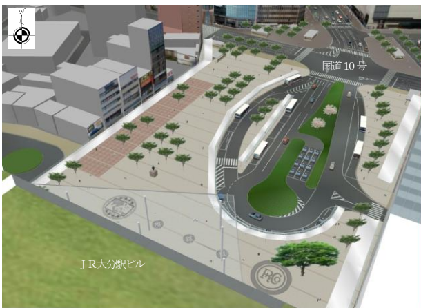
北口駅前広場イメージパース

JR大分駅は1日の平均乗車人員が16,651人(2011年度)で、JR九州の駅別乗車人員数で4位に位置しており、九州における鉄道ネットワークの拠点的な駅となっています。