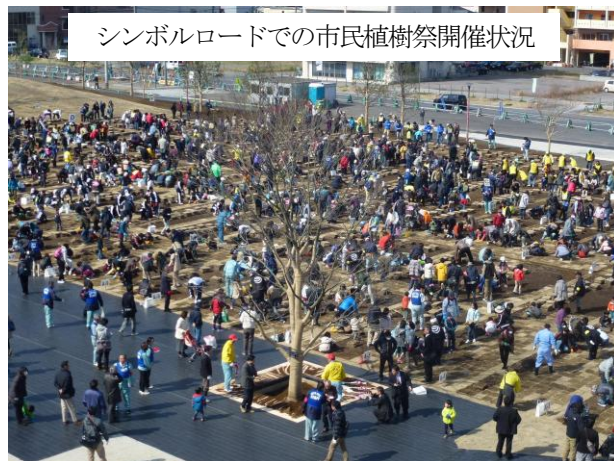
シンボルロードでの市民植樹祭開催状況

市民が主体となって広場を育て、市民のための広場を目指すことから、本年3月には2,700名の市民参加のもと市民植樹祭を開催し、市民の手による芝張りや植樹を行う中で、広場の北半分の整備が完了し、隣接するホルトホール大分の本年7月20日開館に合わせ、広場の解放を予定しています。残りの南半分については11月に市民植樹祭を予定しています。